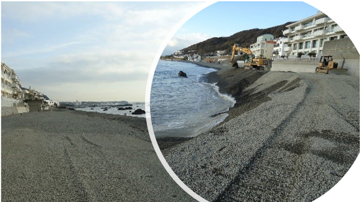
海岸の浸食対策工事