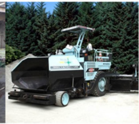
アスファルト フィニッシャー 6.0m