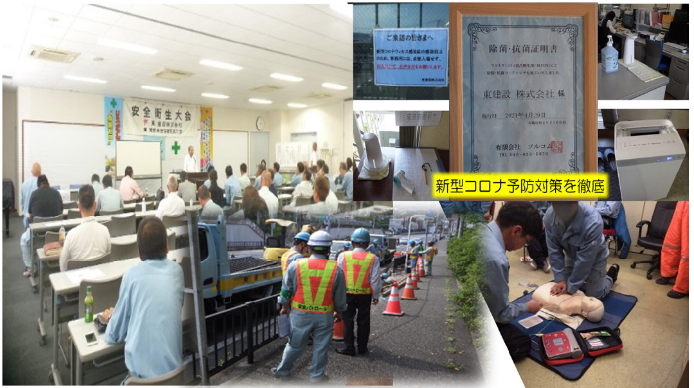
新型コロナウイルス予防対策を徹底