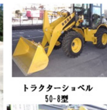
トラクターショベル 50-8型