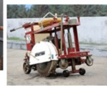
円形切断路面カッター