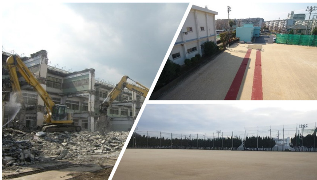
解体工事・グラウンド整備工事

一貫して「誠実」「信頼」をモットーに高度な技術集団としての道を追求し続けています。