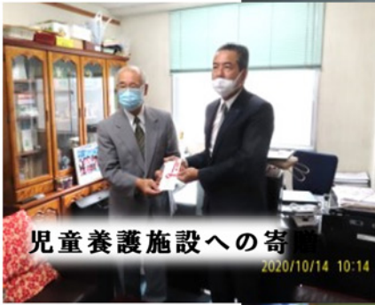
児童養護施設への寄