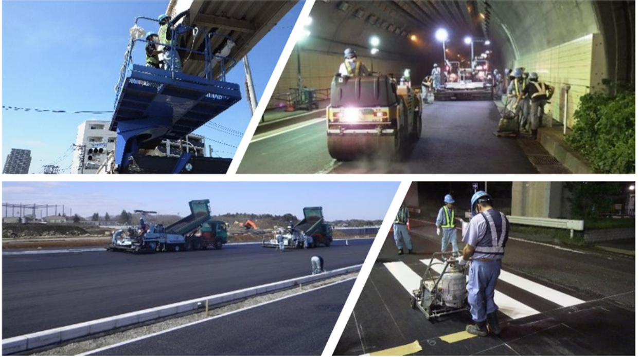
舗装・道路維持工事