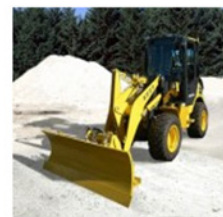
トラクターショベル 除雪対応 50-6型