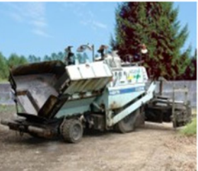
アスファルト フィニッシャー 3.0m