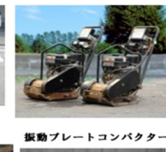
振動プレートコンパクター