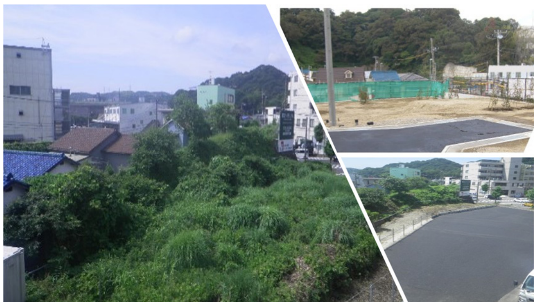
雑地の造成工事（空地等の活用）