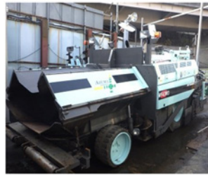
アスファルト フィニッシャー 4.3m