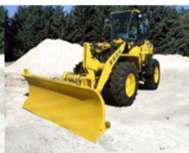
トラクターショベル 除雪対応 100-7型