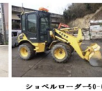
ショベルローダー50-6