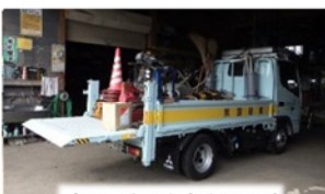
パワーリフト2tトラック