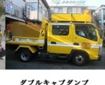
ダブルキャブダンプ