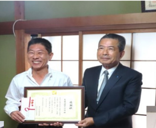
若者育成法人への寄贈