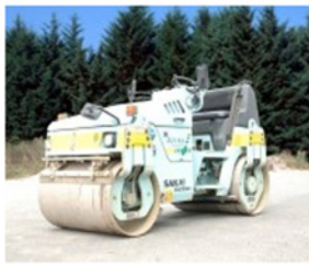
振動ローラー 3 t