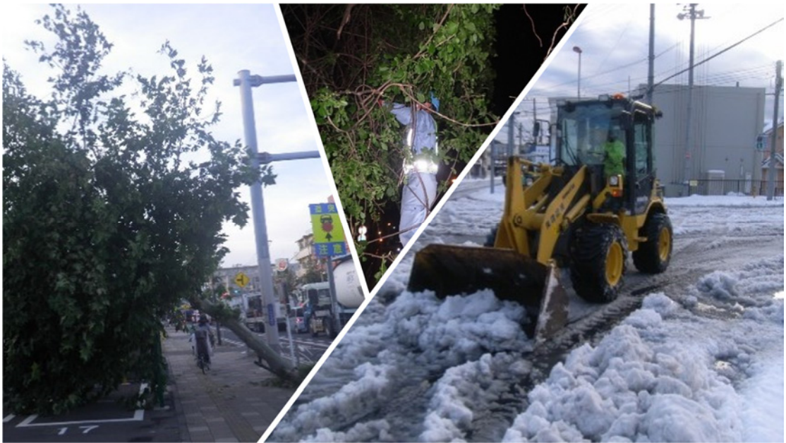
各種災害の復旧工事