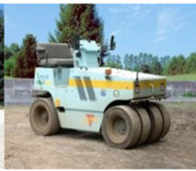
タイヤローラー 3 t