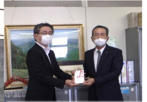
教育福祉支援基金への寄贈