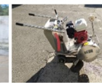
コンクリートカッター