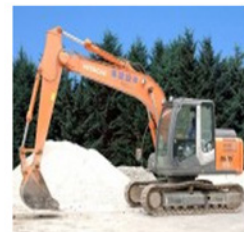
クレーン機能油圧 ショベル 0.5t