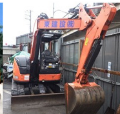
クレーン機能油圧 ショベル 0.25t