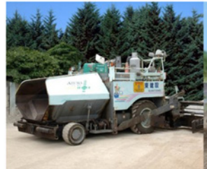
アスファルト フィニッシャー 4.4m