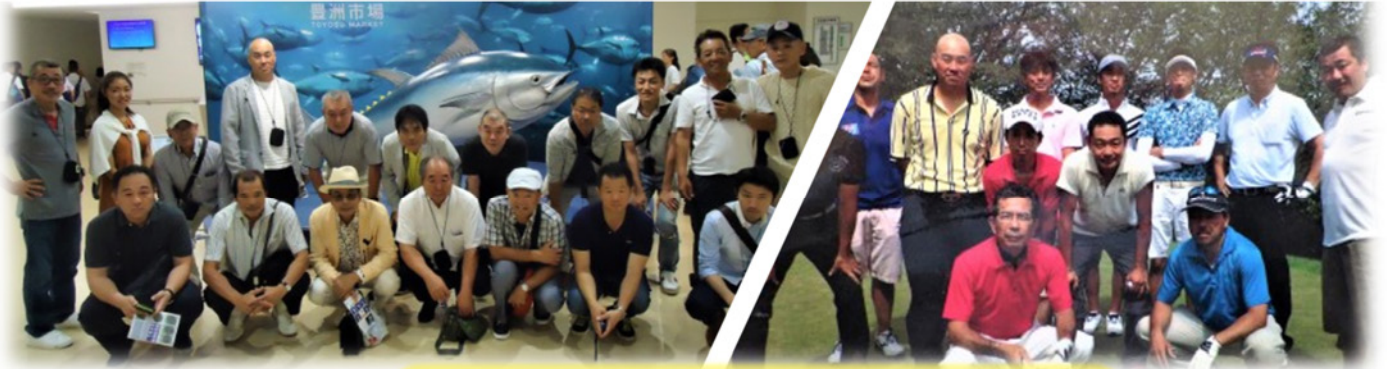
東友会懇親会活動の様子