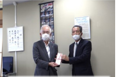
日本赤十字社への寄贈