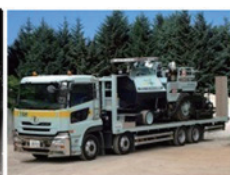
大型回送車 13.5 t