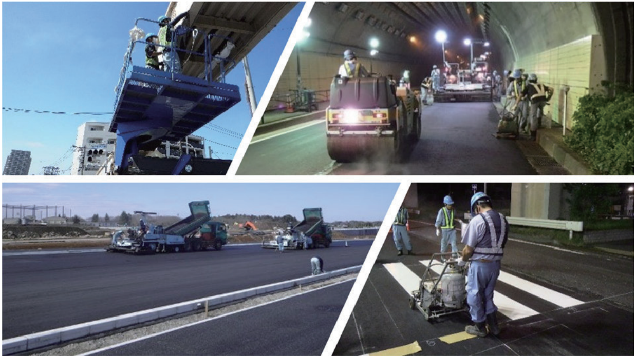
舗装・道路維持工事