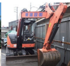
クレーン機能油圧 ショベル 0.25m