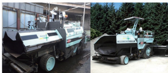
アスファルト フィニッシャー 4.3m