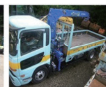
3 t ユニック車