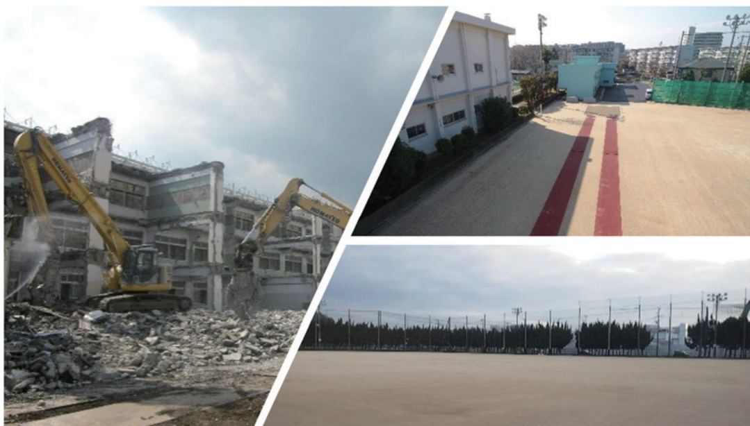
解体工事・グラウンド整備工事

一貫して「誠実」「信頼」をモットーに高度な技術集団としての道を追求し続けています。