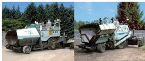
アスファルト フィニッシャー 4.4m