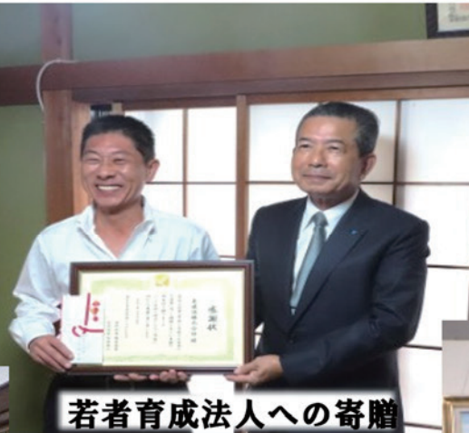
若者育成法人への寄贈