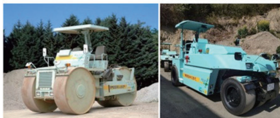
ロードローラー 10 t