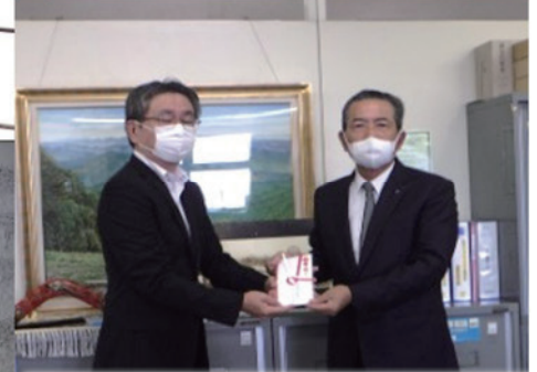
教育福祉支援基金への寄贈