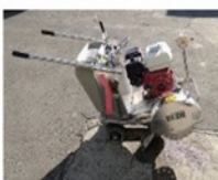
コンクリートカッター