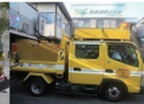
ダブルキャブダンプ