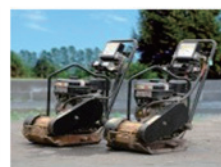
振動プレートコンパクター