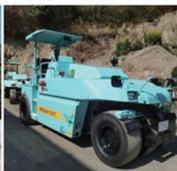
タイヤローラー 10 t