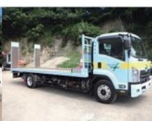
回送車 8 t