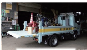
パワーリフト2tトラック