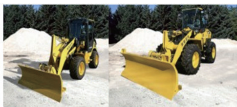
トラクターショベル 除雪対応 50-6型