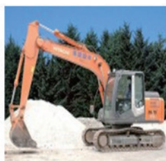
クレーン機能油圧 ショベル 0.5m