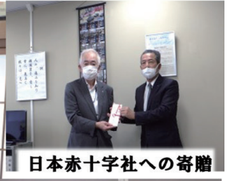
日本赤十字社への寄贈