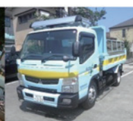
4 t ダンプ