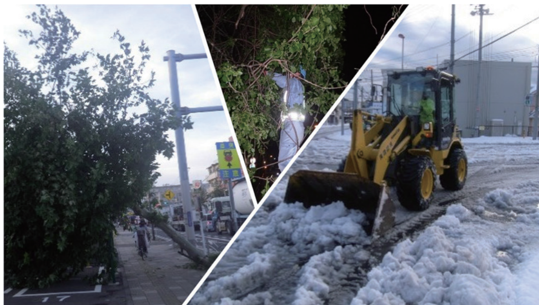
各種災害の復旧工事