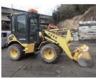
ショベルローダー 50-6