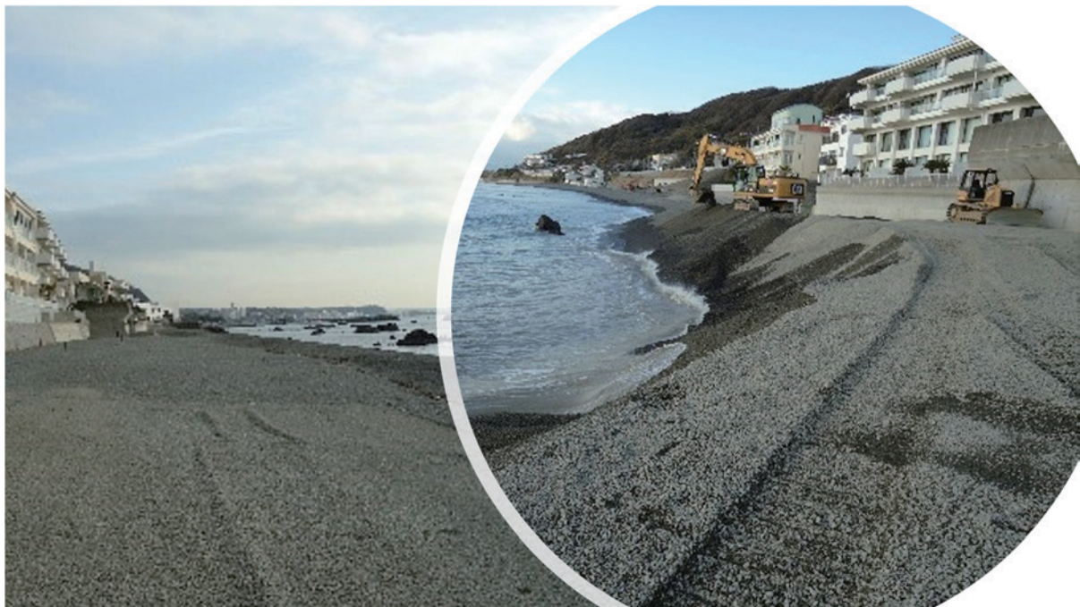
海岸の浸食対策工事