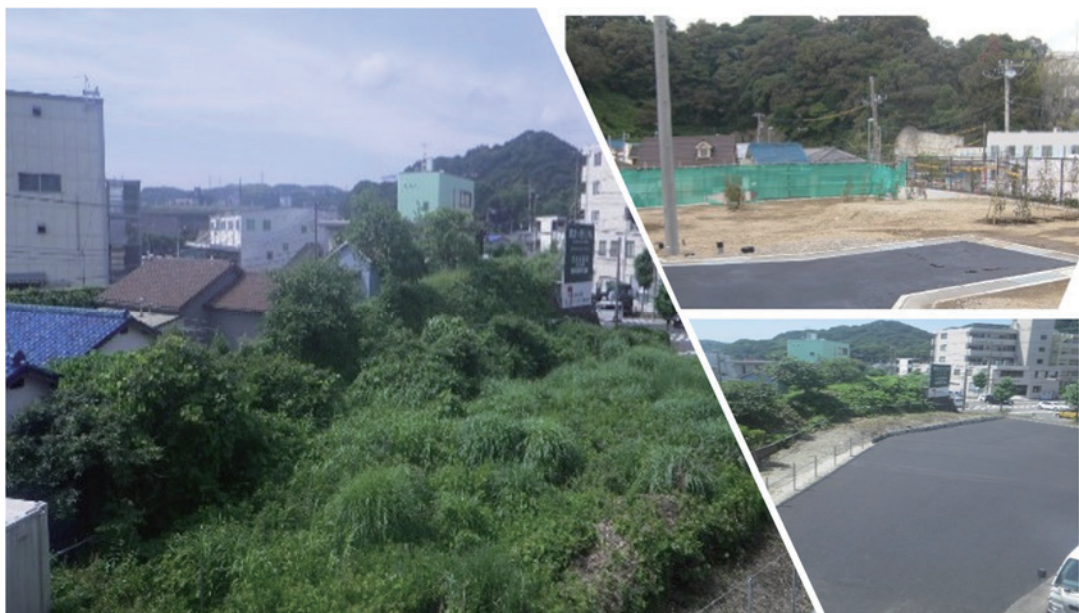
雑地の造成工事（空地等の活用）