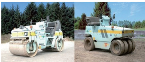
振動ローラー 3 t