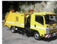
ロードスィーパー