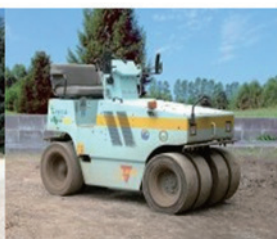
タイヤローラー 3 t