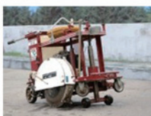
円形切断用路面カッター