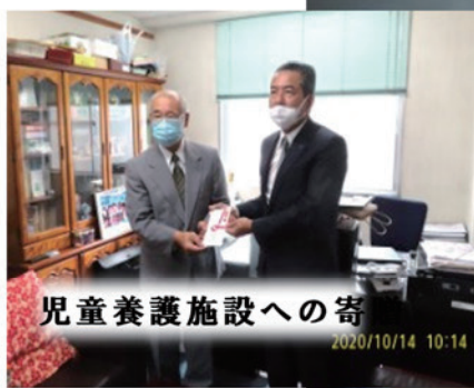
児童養護施設への寄贈