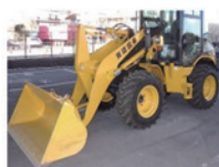
トラクターショベル 50-8型